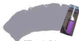
Wit om te tinten + Antraciet