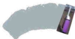
Wit om te tinten + Duif