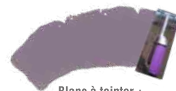
Blanc à teinter + Parme