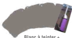
Blanc à teinter + Anthracite