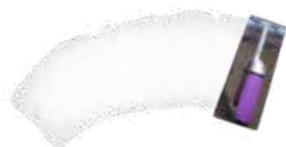
Wit om te tinten