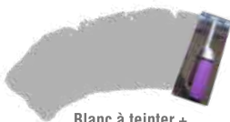
Blanc à teinter + Plume