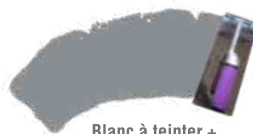
Blanc à teinter + Colombe