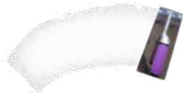
Blanc à teinter