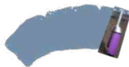
Wit om te tinten + Ocean