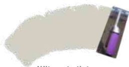
Wit om te tinten + Haver