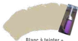
Blanc à teinter + Avoine