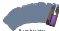
Blanc à teinter + Océan