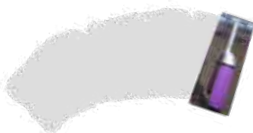
Wit om te tinten + Pluim