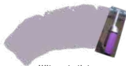
Wit om te tinten + Paars